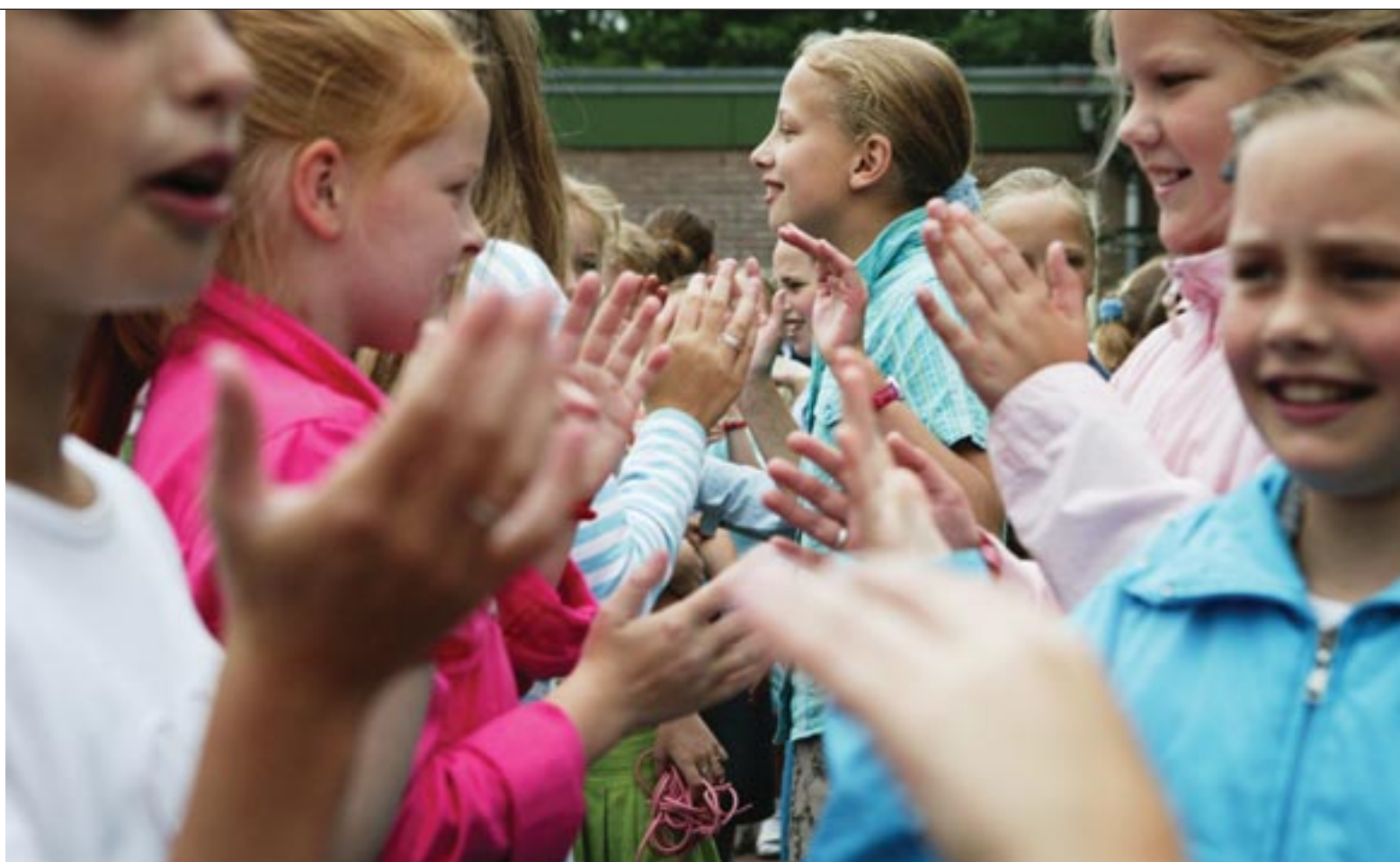
Directeur en leerlingen van de Eben Haëzerschool, Barneveld